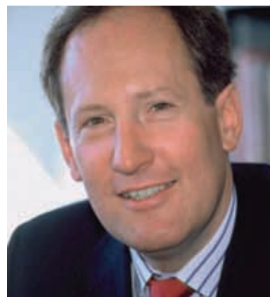
CEO de Tamedia

– Il est certain que la somme est conséquente, mais Edipresse Suisse est un groupe de médias exceptionnel, dont le dynamisme se concentre justement dans les secteurs clés qui nous intéressent en termes de stratégie : journaux, magazines et médias numériques. De plus, PPSR versera en 2011 et 2012 une enveloppe de dividendes. Conformément au contrat jusqu'alors en vigueur, nous